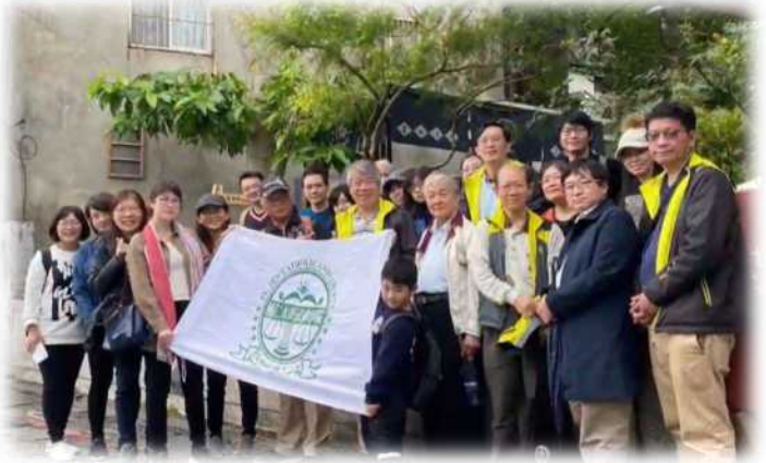
▲法律學院院長、系主任們、師長、秘書及眷屬們合影留念

2020年12月7日於三峽進行本院的自強活動，本次加入文創參訪及手作課程，帶來不同於以往的體驗。三峽一日體驗，首要參訪著名的祖師廟，在疫情期間，祈求大家闔家健康平安。融入結合在地特色的文創行程，讓我們看到老建築故事以新創方式而生生不息。中午時分沿著三峽河畔漫步，選擇一家百年古厝改建的料理食堂，用在地當季有機食材饗宴我們的味蕾。最後免不了要帶上金牛角麵包當作伴手禮，天資聰穎的我們帶著忐忑的心情學做牛角麵包，最後可是各自帶自己做的牛角麵包回家囉～真是一場學習及體驗都滿滿的自強活動～