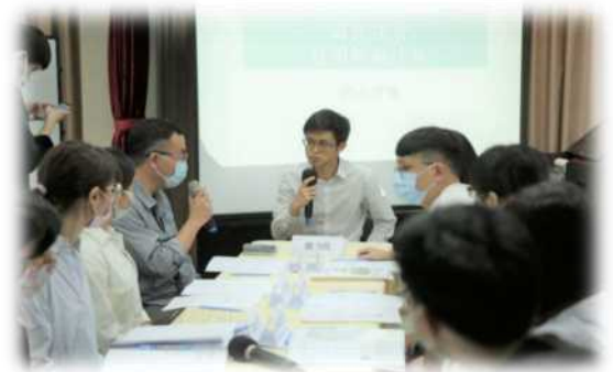
▲國民法官選任程序(左圖)、審理程序(右上圖)、終局評議(右下圖)， 審判長由新北地院時瑋辰法官擔任及指導。

學士後法律系於2020年11月25日舉辦了「學法系國民法官模擬法庭展演」，這次的展演活動是與司法院、台灣新北地院合作，由本校法律學院學法系籌備展演，徵求系上學生擔任模擬法庭中的各項角色，司法院提供演練案例，並向在地法院邀請帶領模擬法庭展演之法官。