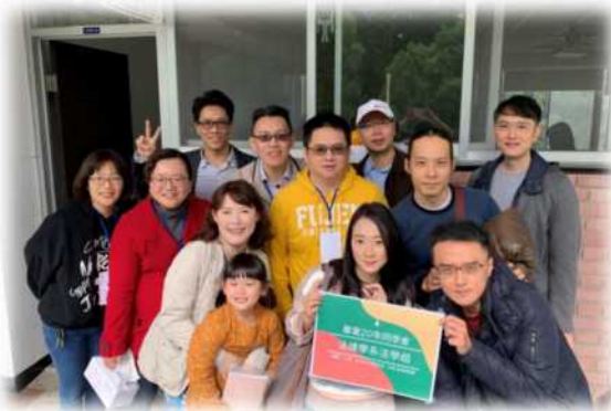
▲法律系畢業二十年同學會

法律學系畢業 20 年及畢業 10 年的系友返校舉辦同學會，分享彼此畢業後迄今的點滴，喚起彼此曾經的熟悉後，話匣子停下不來，現場歡笑聲不斷。