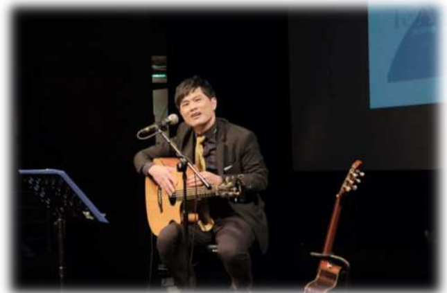
▲ 蘇明淵學長傾情演出

2020年11月18日邀請榮獲第31屆金曲獎最佳台語男歌手獎的律師歌手蘇明淵學長回母校,在聖言樓百鍊展演廳與師生們分享他如何從對音樂的鍾愛走向法庭,再從法庭走向金曲獎的心路歷程。蘇學長從事律師工作22年,期間從不放棄音樂創作,他把訴訟案件,甚至是當事人的心聲都當成是創作養分。蘇學長現場渾厚動人的歌聲,唱出了人生百態,獲取金曲評審激賞,終於在半百之年勇奪金曲獎台語歌王寶座。學長分享時激動地說:「不因為怕死,就不敢活。」因此才能圓了歌王的逐夢之路。學長更勉勵在場同學要勇於追夢,當場賺了不少師生的熱淚。