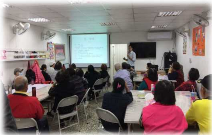
▲法律服務隊至土城及汐止的原民活動中心社區法治宣導