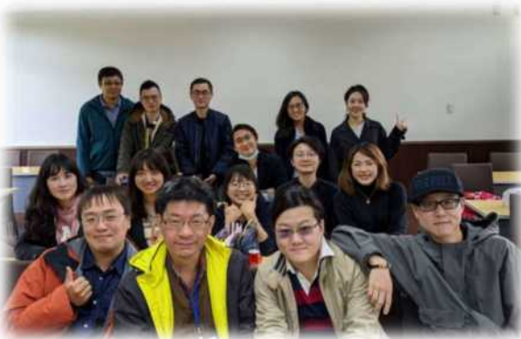
▲法律系畢業十年同學會