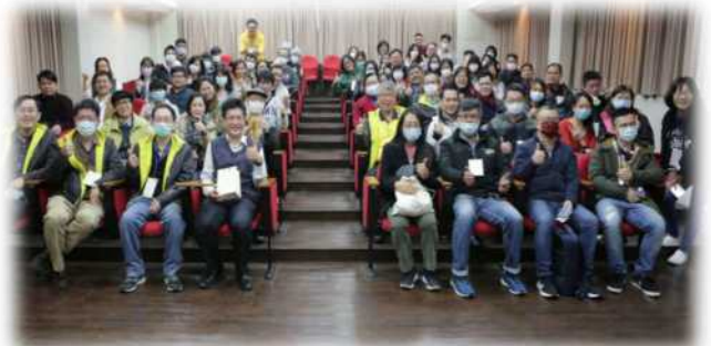
▲系友回娘家全體大合照