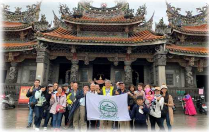
▲法律學院自強活動成員於三峽祖師廟前合影